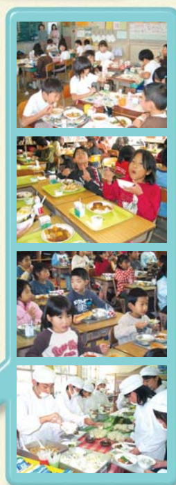
学校又は学校給食共同調理場